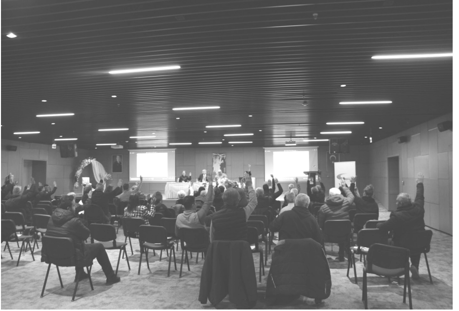
Çanakkale Kent Konseyi Genel Kurulunda rapor sunumu ve kabulü