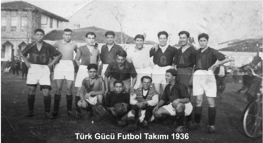
Türk Gücü Futbol Takımı 1936

Çanakkale’de deniz sporlarının başlangıcı da bölge teşkilatının kurulmasıyla faaliyete geçmiş, 1940 Eylül ayında İzmir’de yapılan Fuar Kupası yüzme yarışmalarına Çanakkale’den Ali Dalyancı başkanlığında bir yüzme